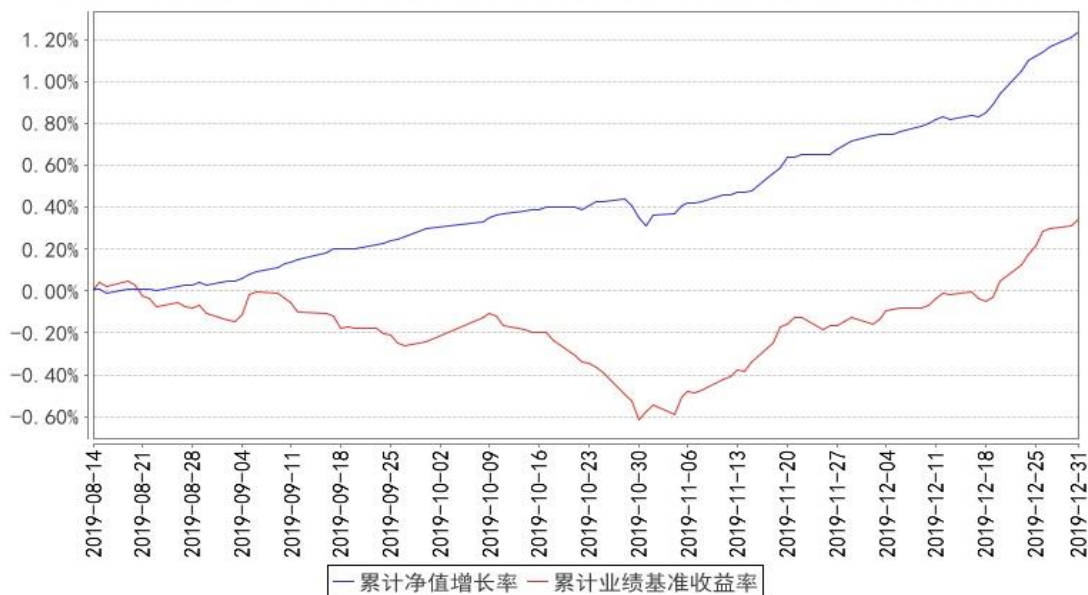
鹏华丰登债券累计净值增长率与同期业绩比较基准收益率的历史走势对比图

注:1、本基金基金合同于 2019 年 08 月 14 日生效。2、截至建仓期结束,本基金的各项投资比例已达到基金合同中规定的各项比例。