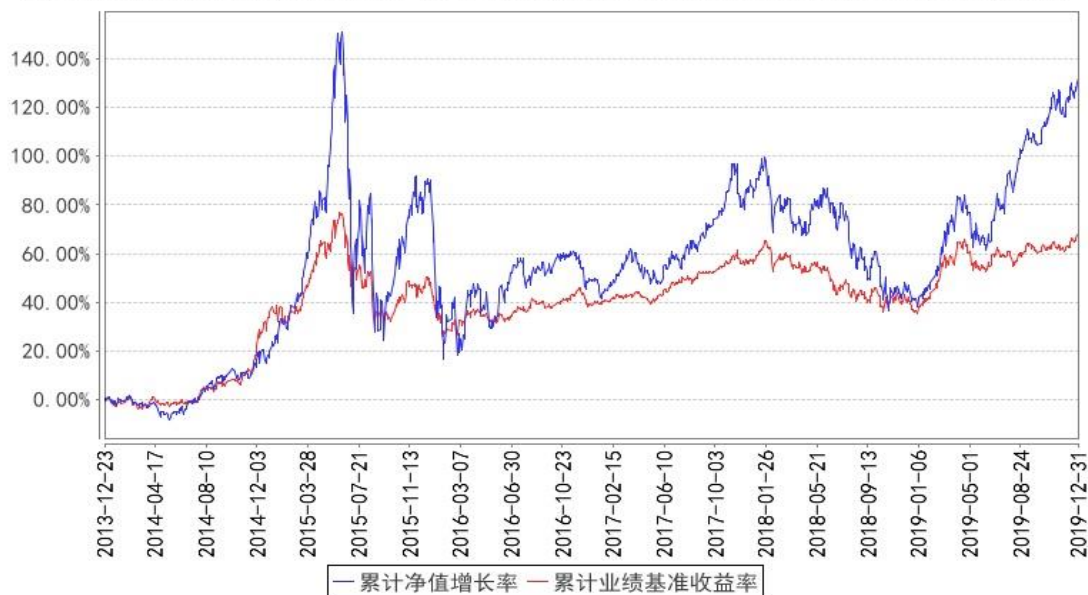
鹏华消费领先混合累计净值增长率与同期业绩比较基准收益率的历史走势对比图

注:1、本基金基金合同于 2013 年 12 月 23 日生效。2、截至建仓期结束,本基金的各项投资比例已达到基金合同中规定的各项比例。