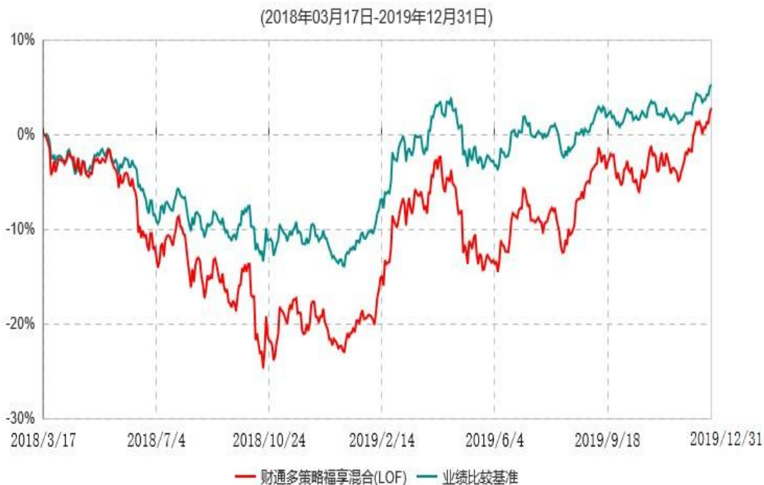
财通多策略福享混合型证券投资基金(LOF)累计净值增长率与业绩比较基准收益率历史走势对比图

注：(1)本基金合同生效日为2016年11月22日，转型日期为2018年3月17日；