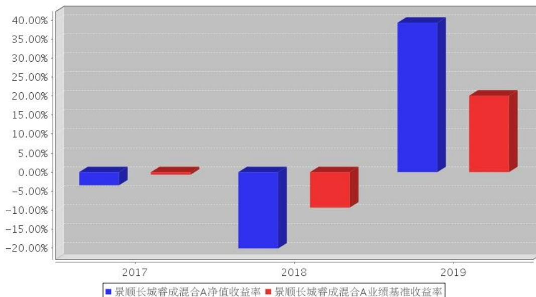
景顺长城睿成混合A基金每年净值增长率与同期业绩比较基准收益率的对比图