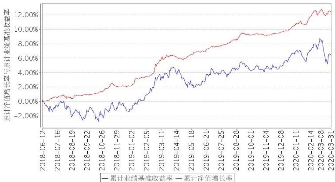
安信永鑫增强债券A累计净值增长率与同期业绩比较基准收益率的历史走势对比图