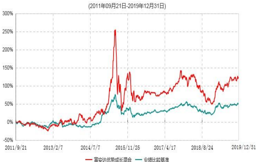
富安达优势成长混合型证券投资基金累计净值增长率与业绩比较基准收益率历史走势对比图

本基金于2011年9月21日成立，根据《富安达优势成长混合型证券投资基金基金合同》规定，本基金建仓期为6个月，建仓截止日为2012年3月20日。建仓期结束时本基金各项资产配置比例符合本基金合同规定的比例限制及投资组合的比例范围。