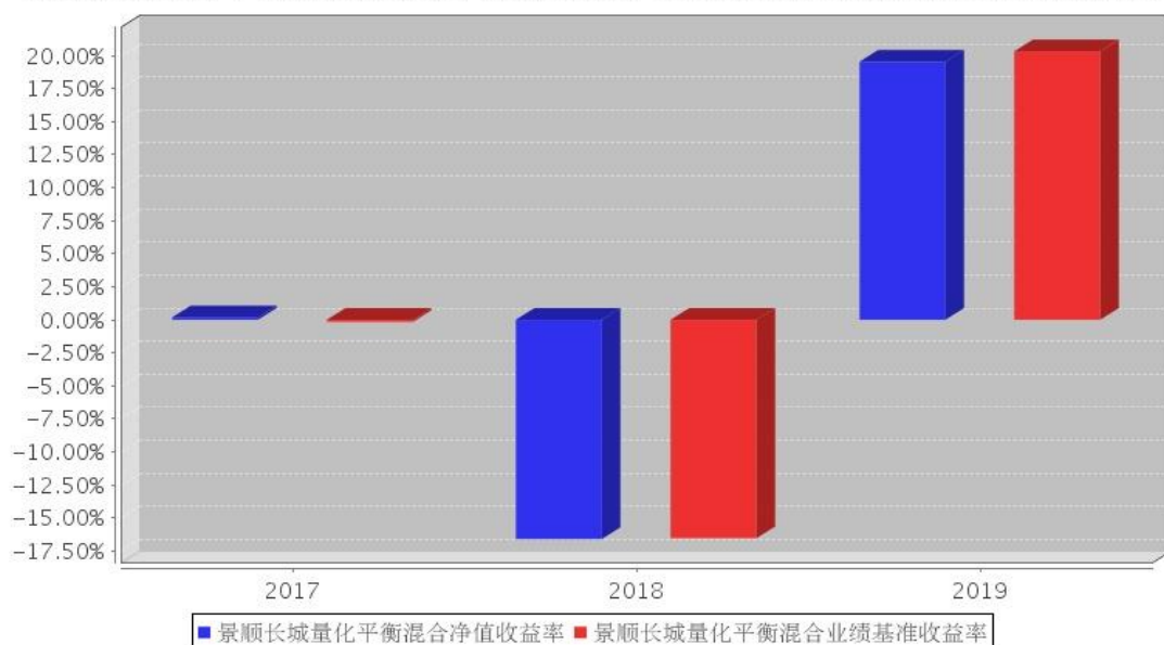
景顺长城量化平衡混合基金每年净值增长率与同期业绩比较基准收益率的对比图