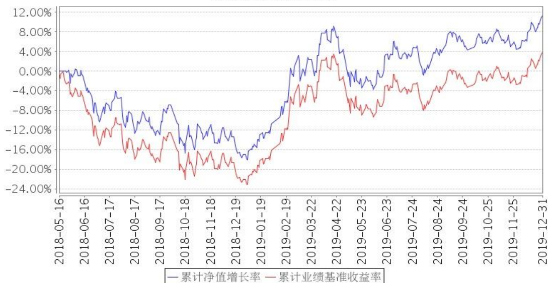
景顺长城MSCI中国A股国际通ETF联接累计净值增长率与同期业绩比较基准收益率的历史走势对比图

注:基金的投资组合比例为:本基金投资于目标ETF的比例不低于基金资产净值的90%,本基金保持不低于基金资产净值5%的现金或到期日在一年以内的政府债券,其中现金不包括结算备付金、存出保证金和应收申购款等。本基金的建仓期为自2018年5月16日基金合同生效日起6个月。建仓期结束时,本基金投资组合达到上述投资组合比例的要求。