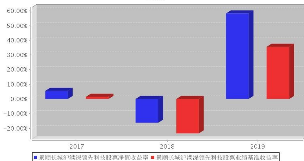
景顺长城沪港深领先科技股票基金每年净值增长率与同期业绩比较基准收益率的对比图

注:2017 年净值增长率与业绩比较基准收益率的实际计算期间是 2017 年 7 月 7 日(基金合同生效日)至 2017 年 12 月 31 日。