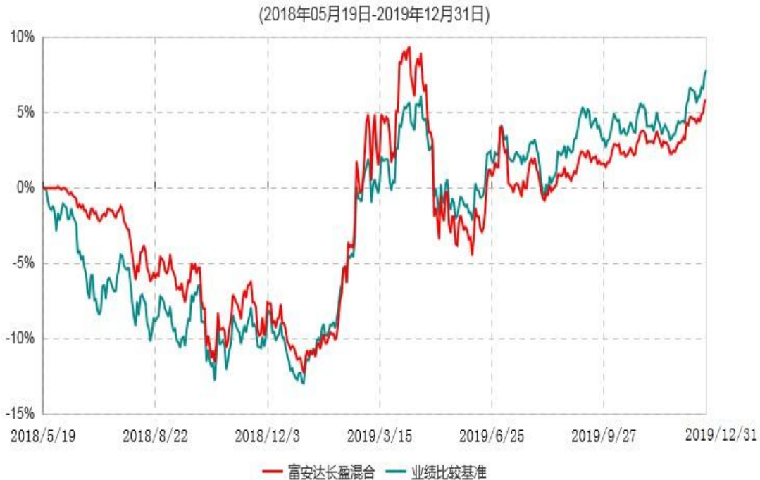
富安达长盈灵活配置混合型证券投资基金累计净值增长率与业绩比较基准收益率历史走势对比图

注：本基金由富安达长盈保本混合型证券投资基金转型而来并于2018年5月19日合同生效，本基金建仓期为自基金转型日起的六个月，建仓截止日为2018年11月18日。建仓期结束时本基金各项资产配置比例符合本基金合同规定的比例限制及投资组合的比例范围。