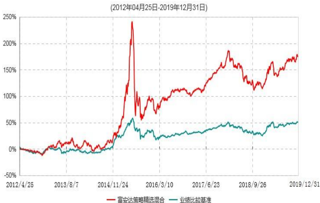
富安达策略精选灵活配置混合型证券投资基金累计净值增长率与业绩比较基准收益率历史走势对比图

注：本基金于2012年4月25日成立，根据《富安达策略精选灵活配置混合型证券投资基金合同》规定，本基金建仓期为6个月，建仓截止日为2012年10月24日。建仓期结束时本基金各项资产配置比例符合本基金合同规定的比例限制及投资组合的比例范围。