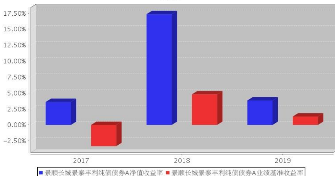
景顺长城景泰丰利纯债债券A基金每年净值增长率与同期业绩比较基准收益率的对比图