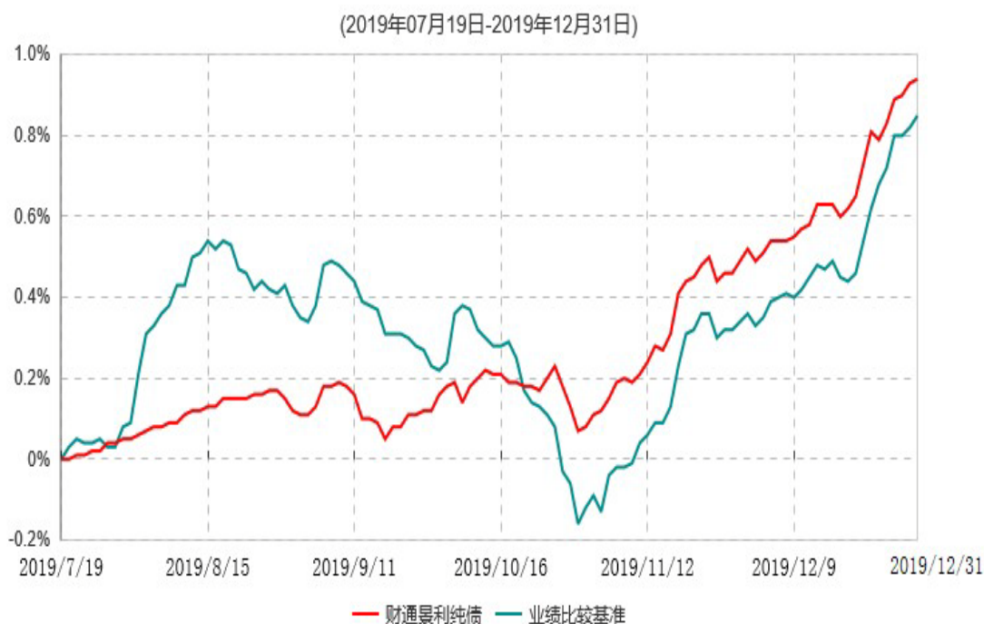
财通景利纯债债券型证券投资基金累计净值增长率与业绩比较基准收益率历史走势对比图

注：(1)本基金合同生效日为2019年07月19日，基金合同生效起至披露时点不满一年；