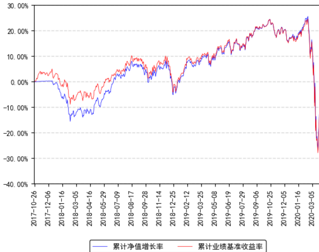
美国REIT累计净值增长率与同期业绩比较基准收益率的历史走势对比图