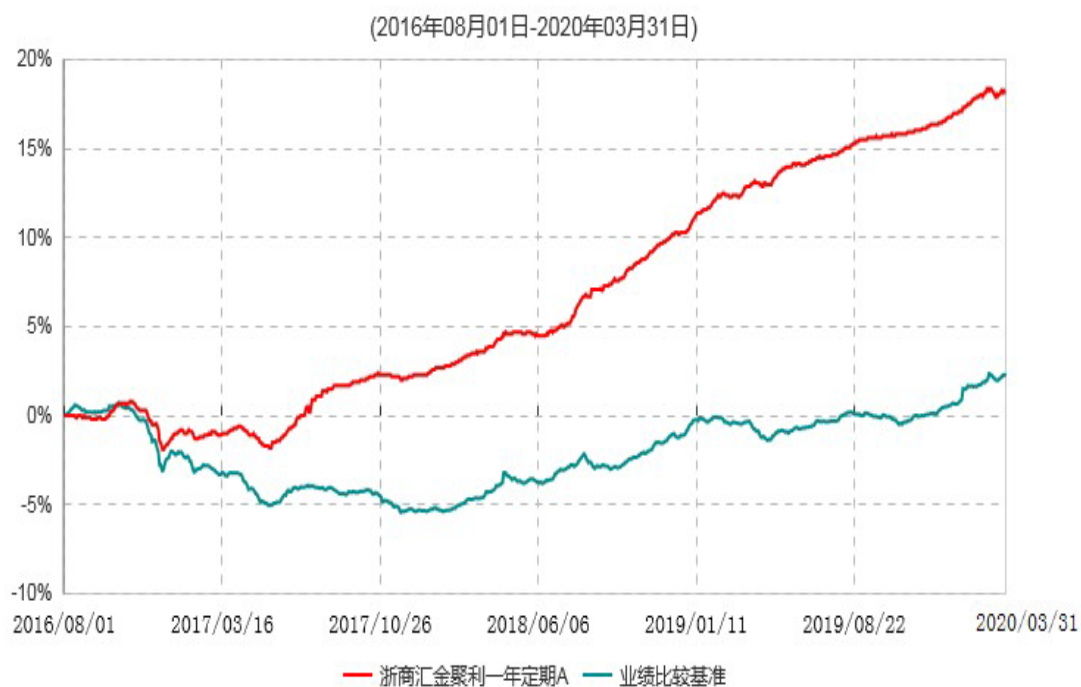
浙商汇金聚利一年定期A累计净值增长率与业绩比较基准收益率历史走势对比图