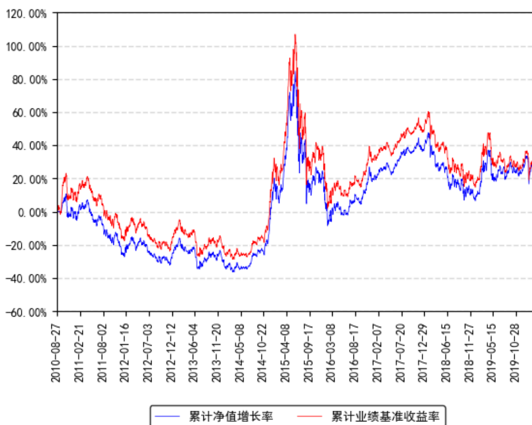
南方小康A累计净值增长率与同期业绩比较基准收益率的历史走势对比图