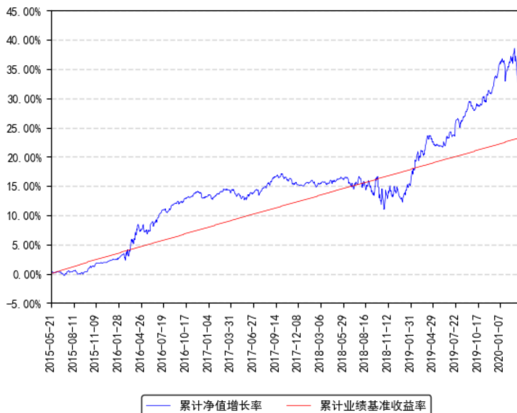
南方利众A类累计净值增长率与同期业绩比较基准收益率的历史走势对比图