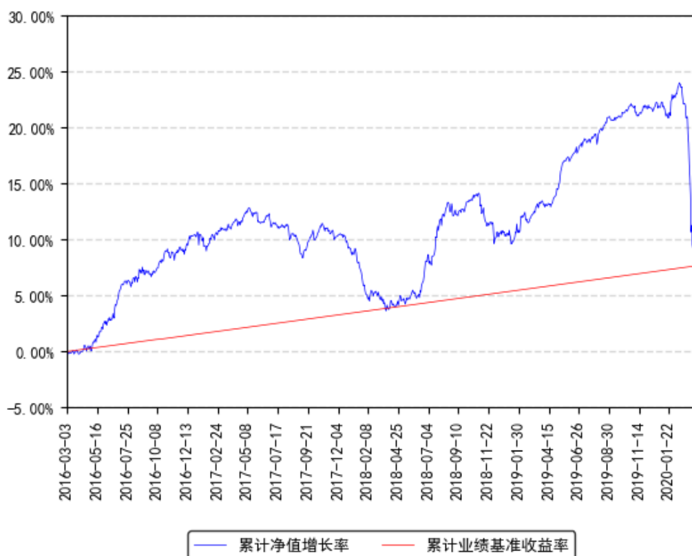
南方亚洲美元债A累计净值增长率与同期业绩比较基准收益率的历史走势对比图