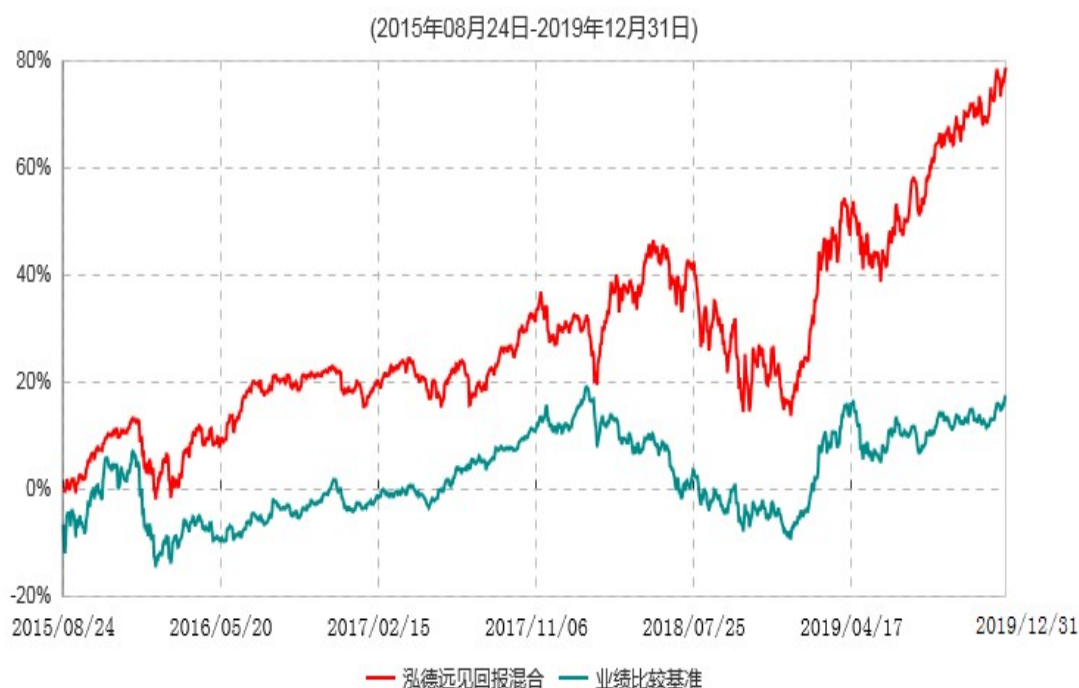
泓德远见回报混合型证券投资基金累计净值增长率与业绩比较基准收益率历史走势对比图

注：根据基金合同的约定，本基金建仓期为6个月，截至报告期末，本基金的各项投资比例符合基金合同关于投资范围及投资限制规定。