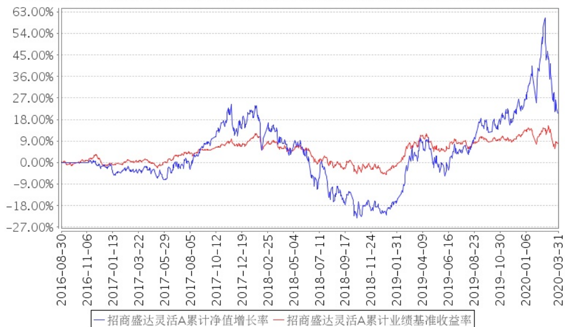
招商盛达灵活A累计净值增长率与同期业绩比较基准收益率的历史走势对比图