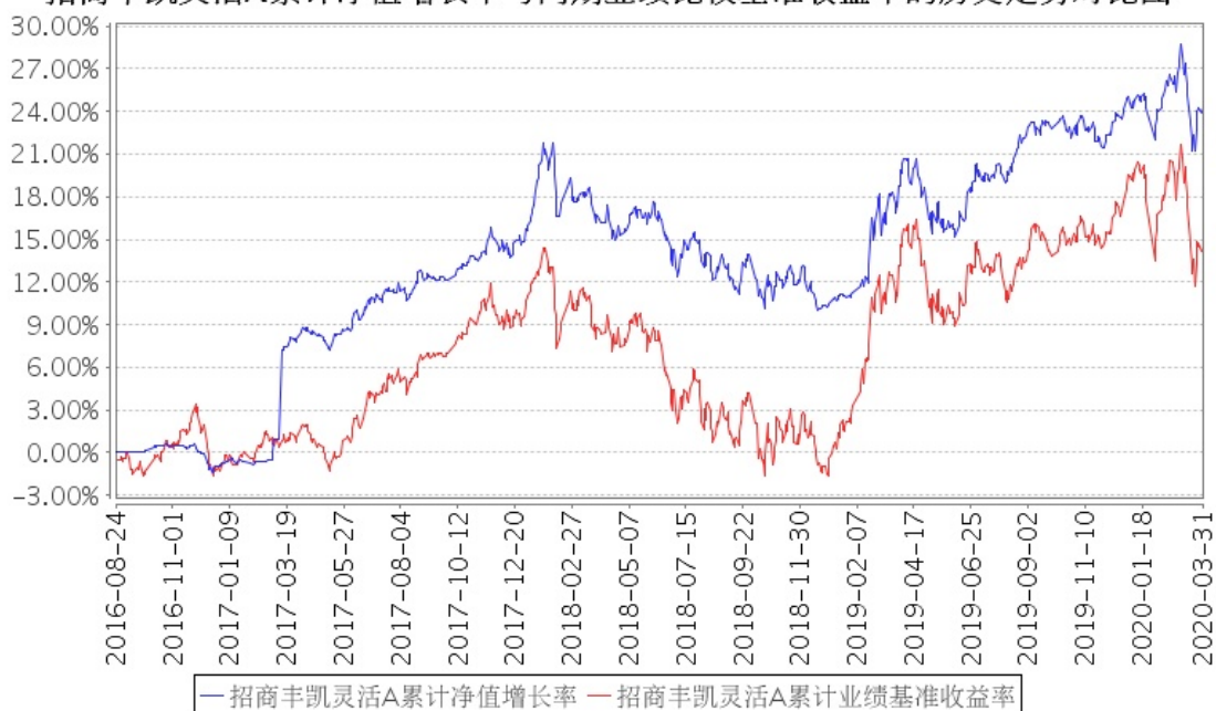
招商丰凯灵活A累计净值增长率与同期业绩比较基准收益率的历史走势对比图