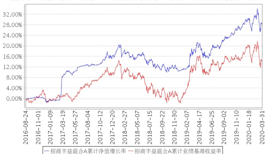
招商丰益混合A累计净值增长率与同期业绩比较基准收益率的历史走势对比图