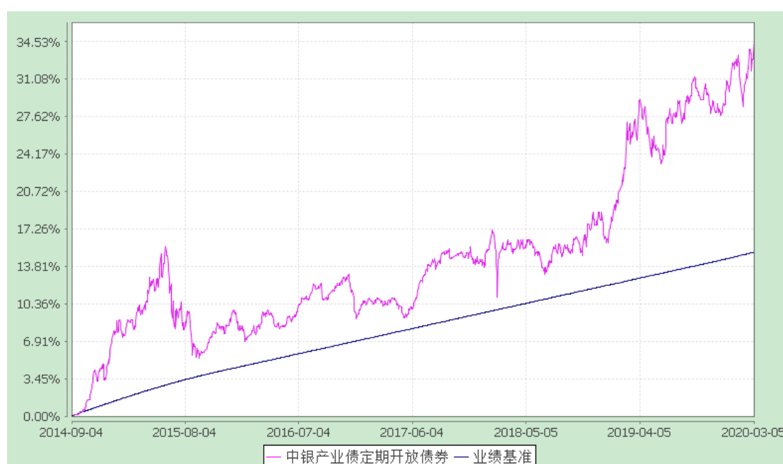
中银产业债一年定期开放债券型证券投资基金 份额累计净值增长率与业绩比较基准收益率历史走势对比图 (2020 年 1 月 1 日-2020 年 3 月 5 日)

注：按基金合同规定，本基金自基金合同生效起 6 个月内为建仓期，截至建仓结束时各项资产配置比例均符合基金合同约定。