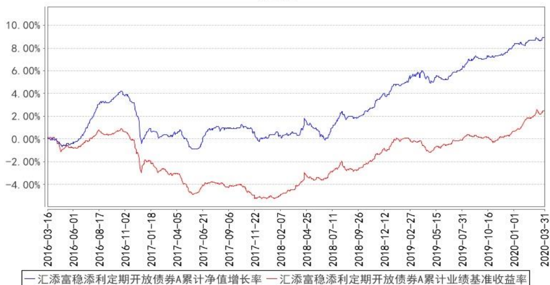
汇添富稳添利定期开放债券A累计净值增长率与同期业绩比较基准收益率的历史走势对比图