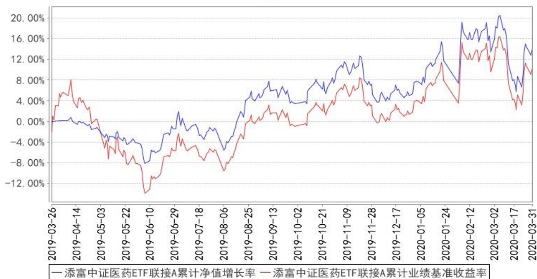
添富中证医药ETF联接A累计净值增长率与同期业绩比较基准收益率的历史走势对比图