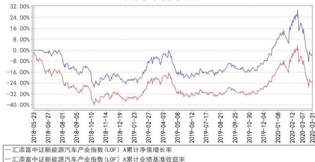
汇添富中证新能源汽车产业指数 (LOF) A 累计净值增长率与同期业绩比较基准收益率的历史走势对比图