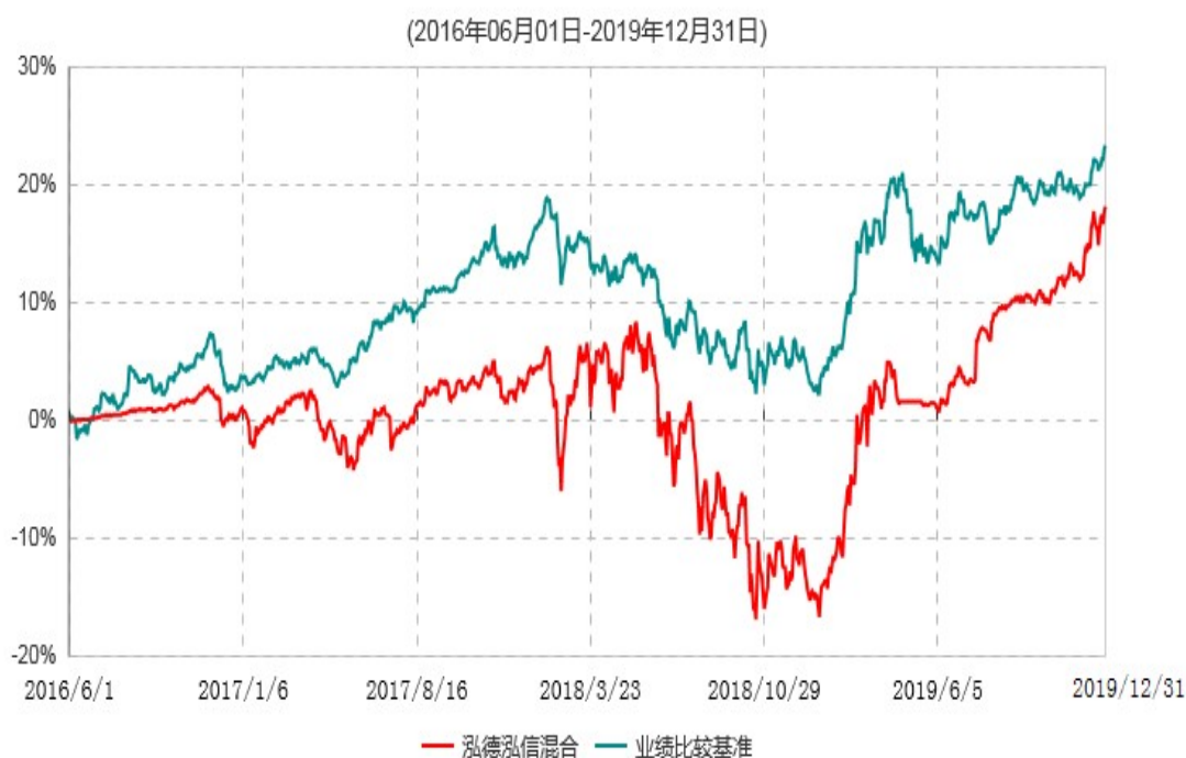
泓德泓信灵活配置混合型证券投资基金累计净值增长率与业绩比较基准收益率历史走势对比图

注：根据基金合同的约定，本基金建仓期为6个月，截至报告期末，本基金的各项投资比例符合基金合同关于投资范围及投资限制规定。