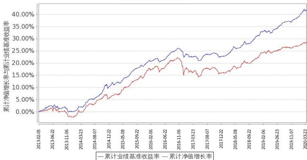
图1：嘉实中证中期企业债指数(LOF)A 基金份额累计净值增长率与同期业绩比较基准收益率的历史走势对比图