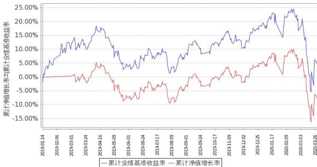
图 2：嘉实港股通新经济指数(LOF)C 基金份额累计净值增长率与同期业绩比较基准收益率的历史走势对比图