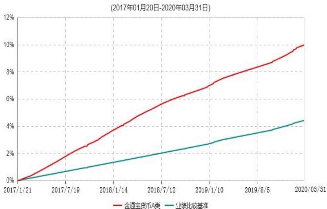
金通宝货币A类累计净值收益率与业绩比较基准收益率历史走势对比图