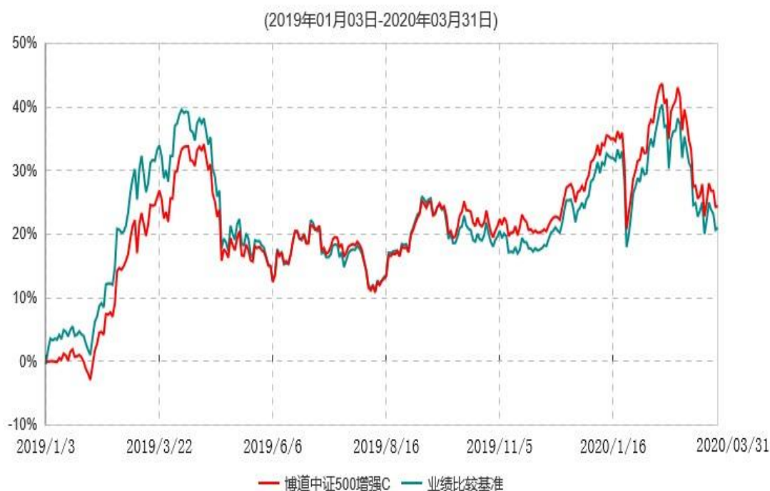
博道中证500增强C累计净值增长率与业绩比较基准收益率历史走势对比图

注：本基金基金合同生效日为2019年1月3日，截至报告期期末，本基金已完成建仓但报告期期末距建仓结束未满一年。本基金建仓期为自基金合同生效日起的6个月。截至建仓期结束，本基金各项资产配置比例符合基金合同及招募说明书有关投资比例的约定。