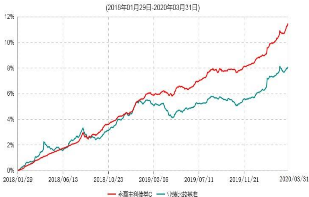
永赢丰利债券C累计净值增长率与业绩比较基准收益率历史走势对比图