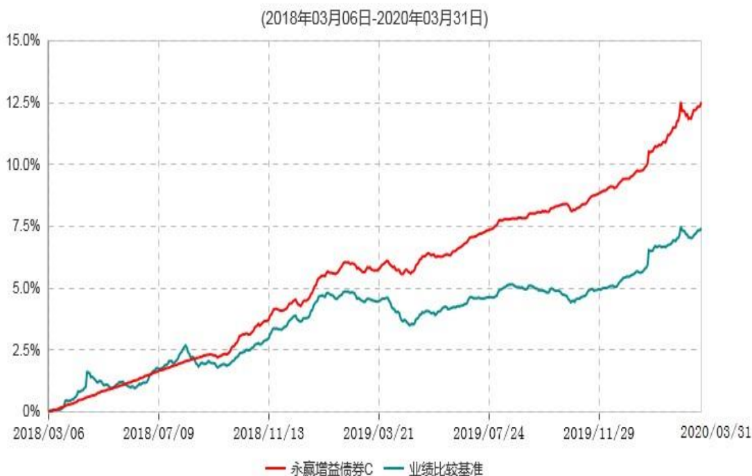
永赢增益债券C累计净值增长率与业绩比较基准收益率历史走势对比图

注：本基金建仓期为本基金合同生效日起 6 个月，建仓期结束当日，除债券投资比例未达到合同约定外，其他各项资产配置符合合同约定。债券投资比例未达到合同约定系交易对手原因导致现券买入交易结算失败所致，本基金于 2018 年 9 月 6 日及时买入债券将债券投资比例提高至合同约定的范围内。