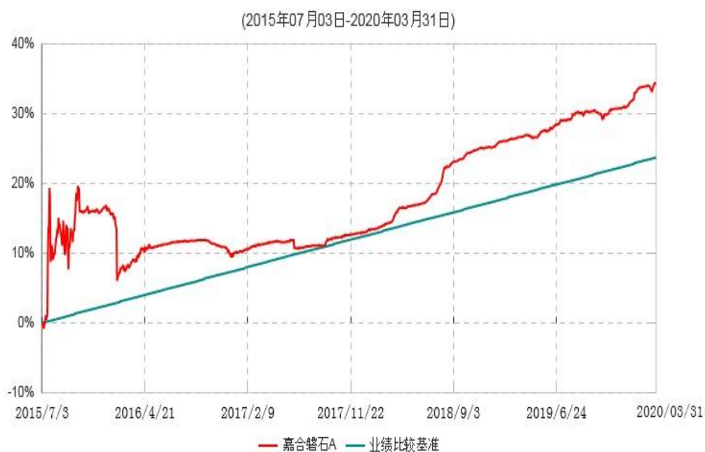
嘉合磐石A累计净值增长率与业绩比较基准收益率历史走势对比图