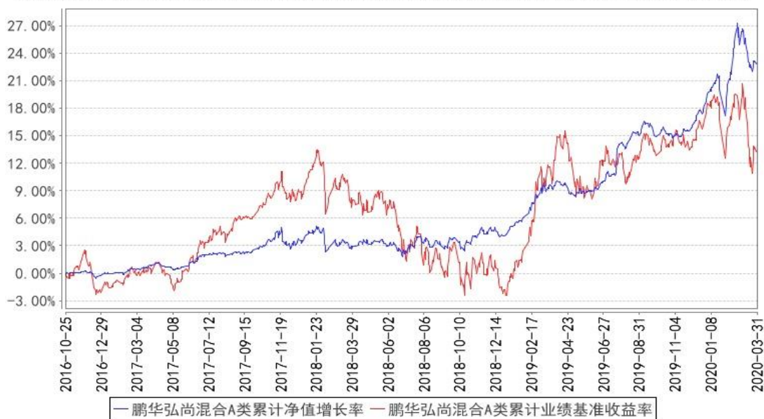
鹏华弘尚混合A类累计净值增长率与同期业绩比较基准收益率的历史走势对比图