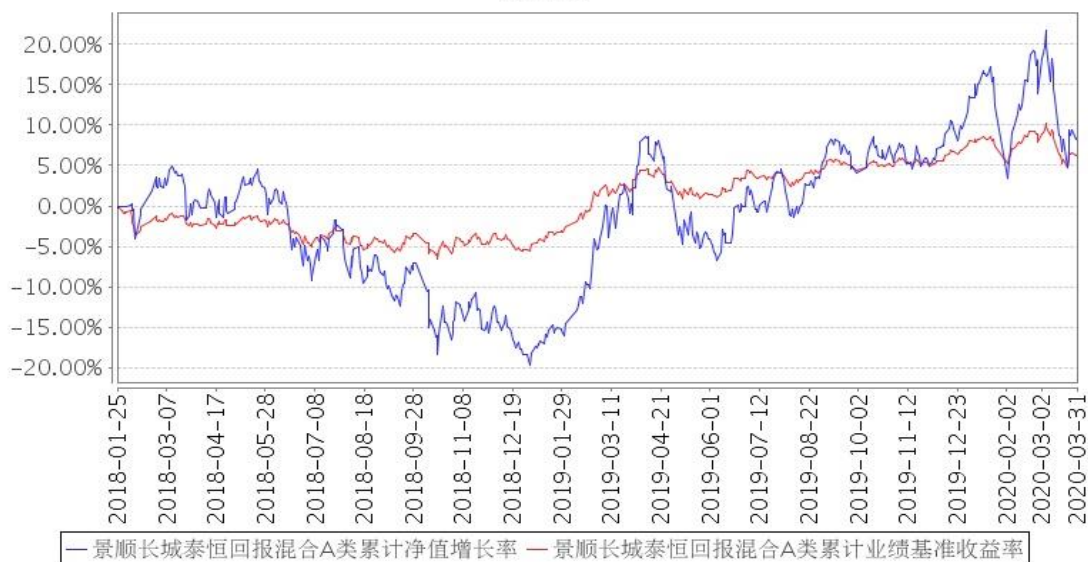
景顺长城泰恒回报混合A类累计净值增长率与同期业绩比较基准收益率的历史走势对比图