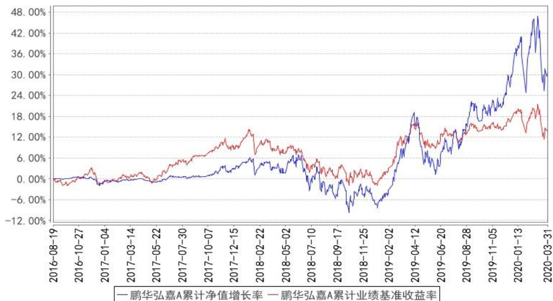
鹏华弘嘉A累计净值增长率与同期业绩比较基准收益率的历史走势对比图