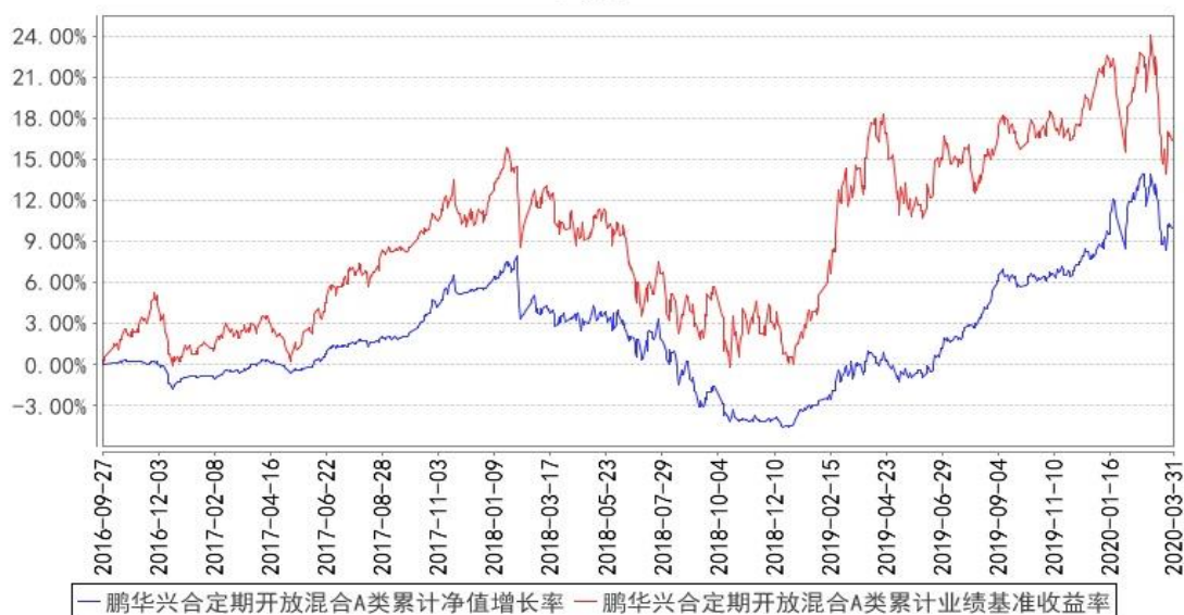
鹏华兴合定期开放混合A类累计净值增长率与同期业绩比较基准收益率的历史走势对比图