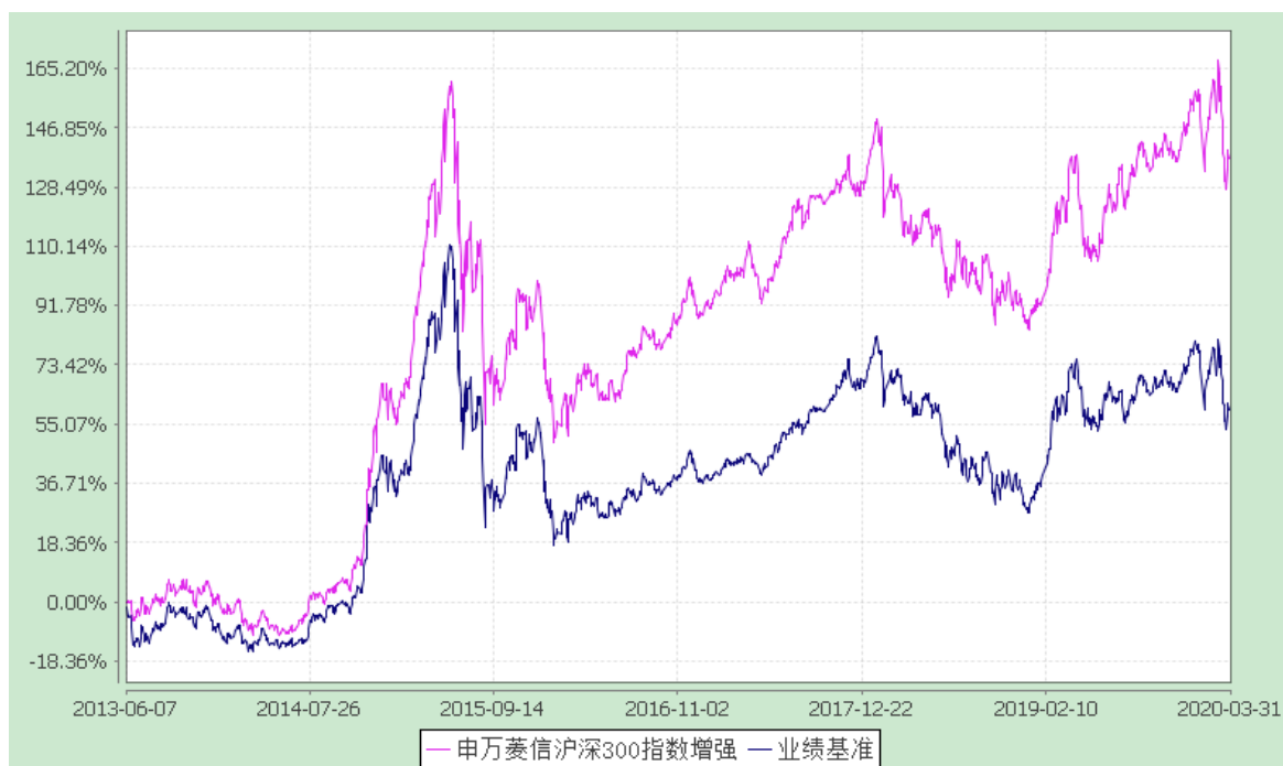
申万菱信沪深 300 指数增强 C