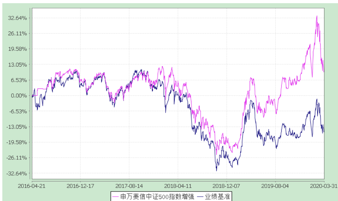
申万菱信中证 500 指数增强 C