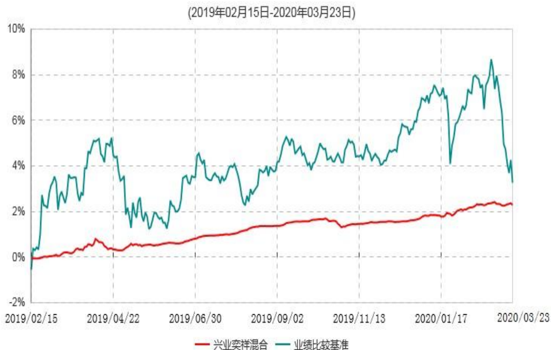
兴业奕祥混合累计净值增长率与业绩比较基准收益率历史走势对比图