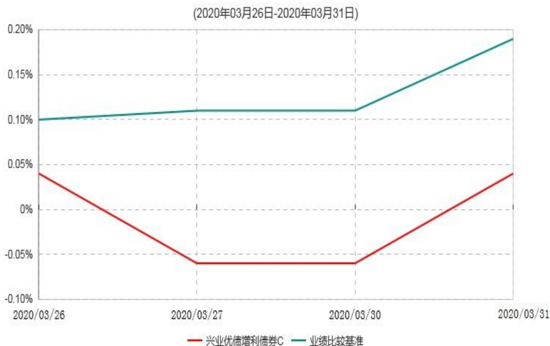
兴业优债增利债券C累计净值增长率与业绩比较基准收益率历史走势对比图

注：1、2020年3月23日本基金基金份额持有人大会表决通过了《关于兴业奕祥混合型证券投资基金转型为兴业优债增利债券型证券投资基金有关事项的议案》。本基金自2020年3月24日起转型为兴业优债增利债券型证券投资基金。《兴业奕祥混合型证券投资基金基金合同》自2020年3月24日起失效，《兴业优债增利债券型证券投资基金基金合同》于同日生效。