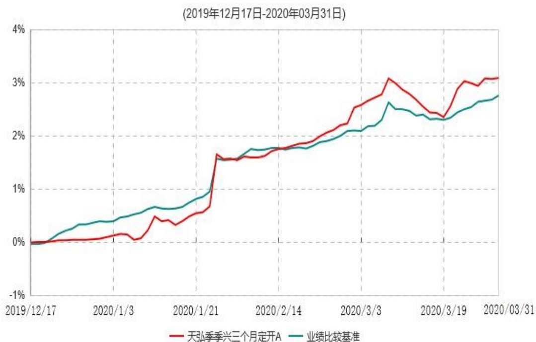
天弘季季兴三个月定开A累计净值增长率与业绩比较基准收益率历史走势对比图