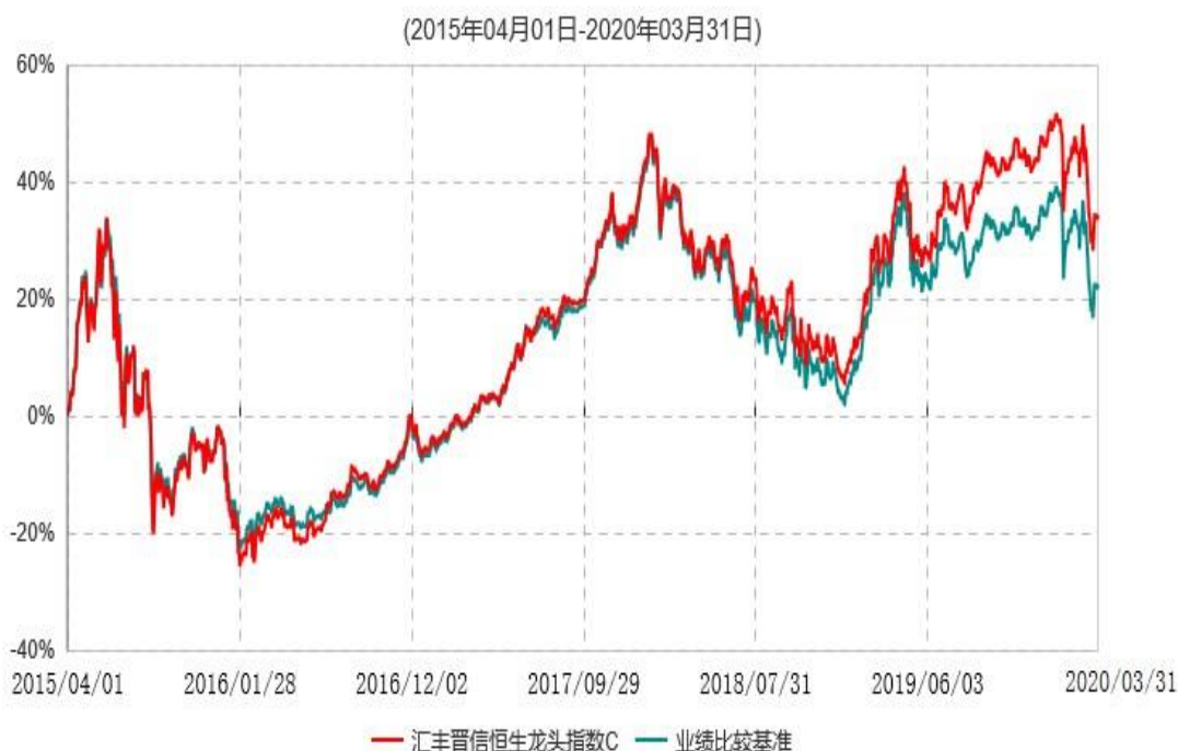
汇丰晋信恒生龙头指数C累计净值增长率与业绩比较基准收益率历史走势对比图