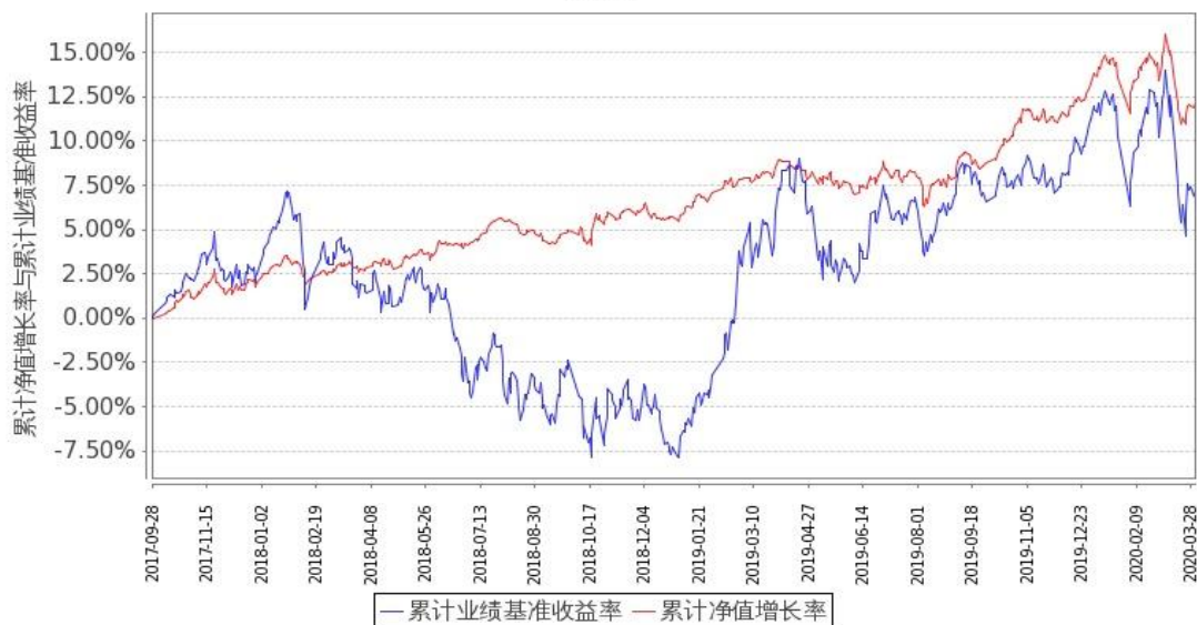
图 1：嘉实新添辉定期混合 A 基金份额累计净值增长率与同期业绩比较基准收益率的历史走势对比图