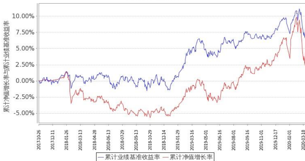
图 2：嘉实领航资产配置混合 (FOF)C 基金份额累计净值增长率与同期业绩比较基准收益率的历史走势对比图