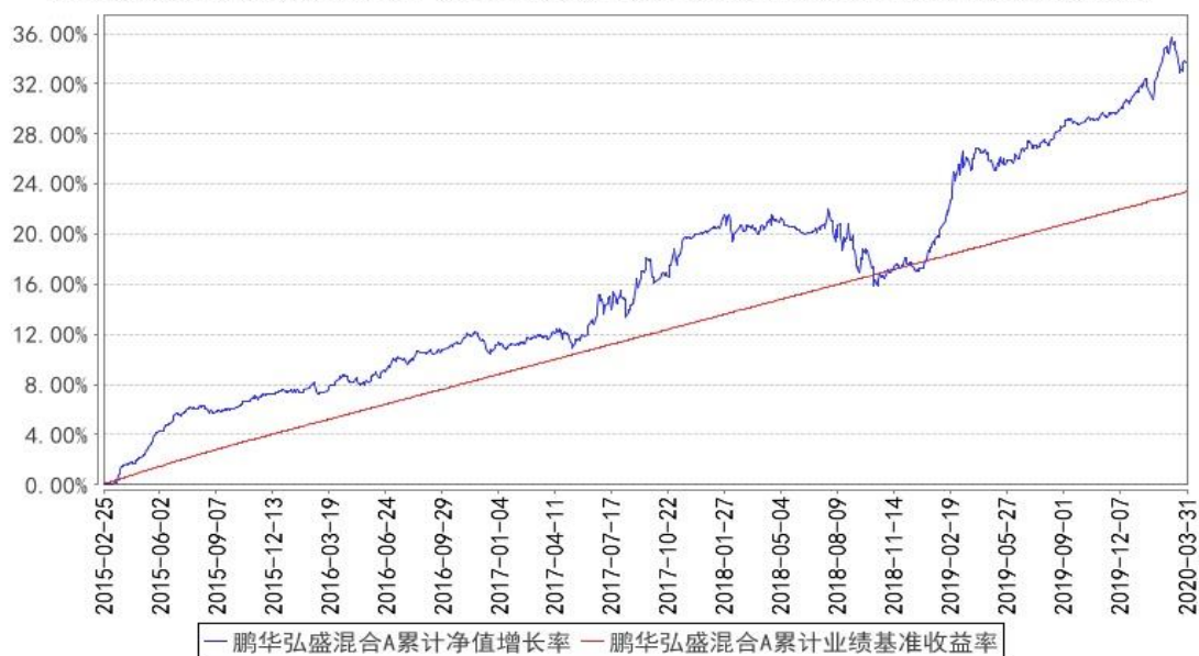
鹏华弘盛混合A累计净值增长率与同期业绩比较基准收益率的历史走势对比图