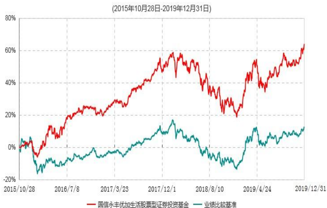
圆信永丰优加生活股票型证券投资基金累计净值增长率与业绩比较基准收益率历史走势对比图