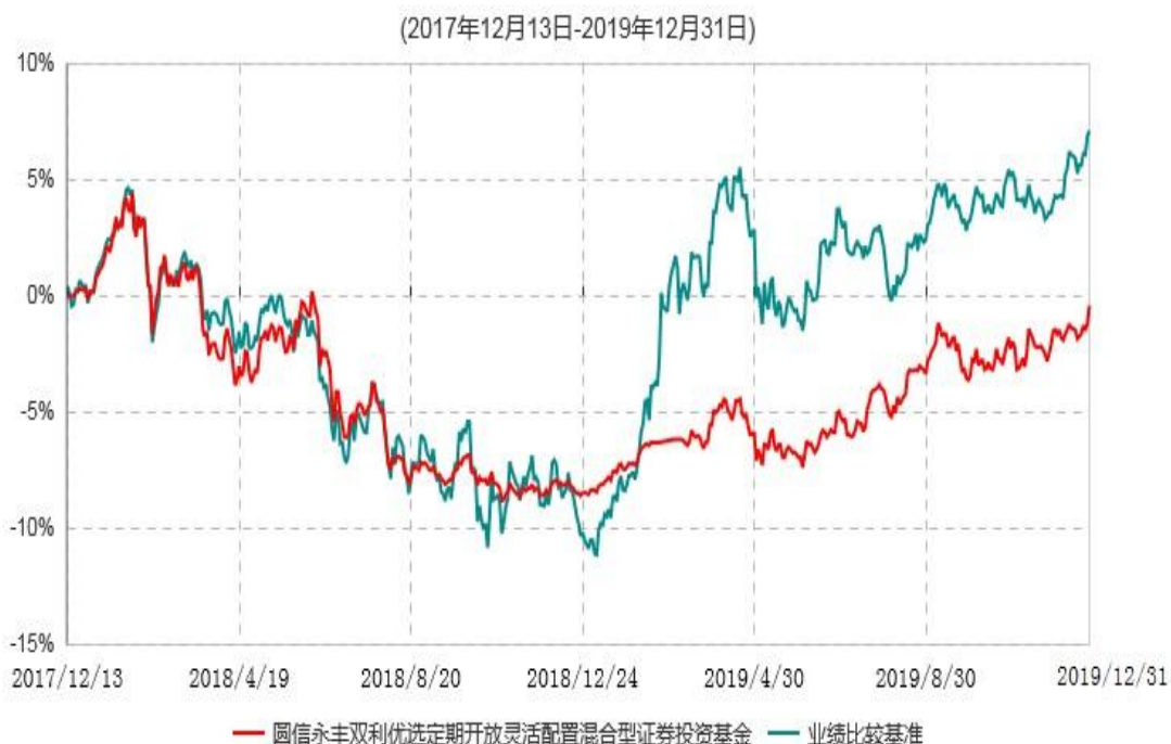
圆信永丰双利优选定期开放灵活配置混合型证券投资基金累计净值增长率与业绩比较基准收益率历史走势对比图