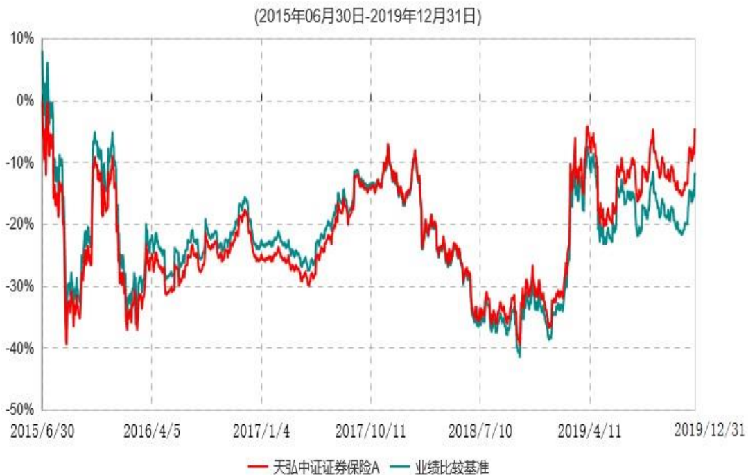
天弘中证证券保险A累计净值增长率与业绩比较基准收益率历史走势对比图