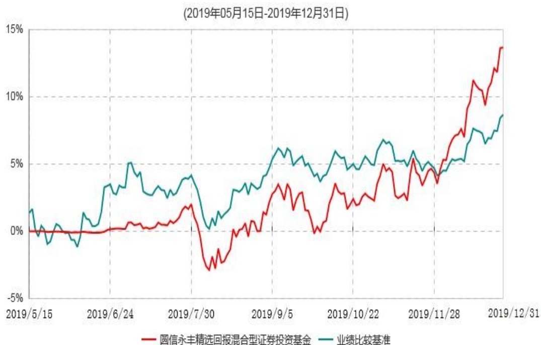
圆信永丰精选回报混合型证券投资基金累计净值增长率与业绩比较基准收益率历史走势对比图

注：自基金合同生效后，截止报告期末，本基金成立不满一年；本基金已完成建仓但报告期末距建仓结束不满一年，建仓结束时各项资产配置比例符合合同约定。